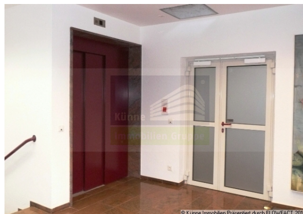
Flur mit Lift